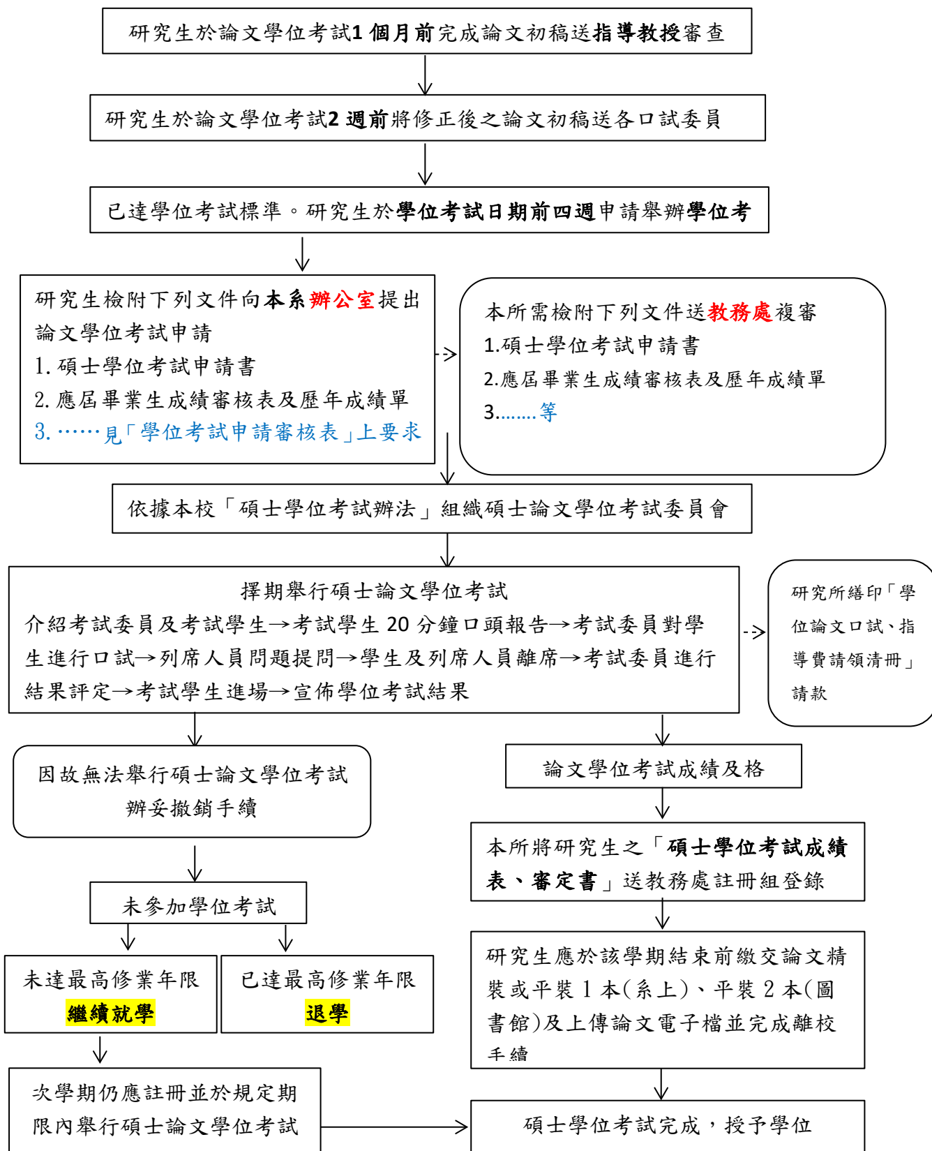
【碩士學位考試流程圖】